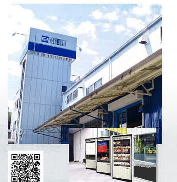
施工例:渋谷ヒカリエ案内サイン

鋼製建具、装飾金物製品、強化ガラス製品、装飾アクリル製品、サイン等の多品目を設計・デザイン・製作・施工までの一貫生産を行っている。お客様のあらゆるニーズに対応するため、営業部門、設計・デザイン部門、製造・加工部門の各セクションが専門性の向上に努めて経験と実績を積み重ねている。社内体制が整っているため、多種多様なあらゆるニーズのフルオーダー製品に対応している。創業から70年におよぶ蓄積されたノウハウをもとに、お客様に「安心」の提供を実現している。