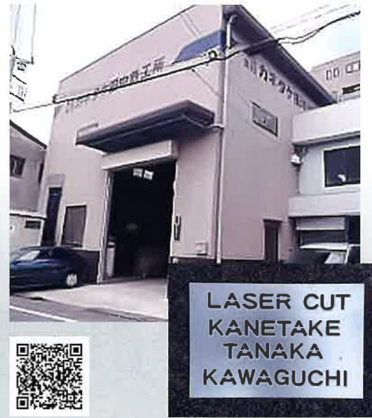
レーザー加工・サンプル

川口市内でいち早くレーザー加工機を導入しながらも、従来通りの機械加工にも対応することができる数少ない事業所である。レーザー加工では多種少ロットを得意とし、鉄・ステンレス・アルミの切断のほか、木材・アクリルなど多岐にわたる材質を扱っている。また、様々な素材を薄板から厚板まで幅広く加工することが可能である。レーザー加工機導入からの長い歴史と実績、培った技術を生かした対応力と製品精度の高さが顧客からの信頼に繋がっている。