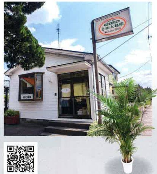
インドア・プランツ

事業内容は、造園工事業をはじめ、貸植木業、植木販売である。主に、公共緑化工事や緑地管理、民間庭園の設計・施工・管理、インドア・プランツによる室内装飾を行っている。明治20年創業以来130年を超える歴史があり、造園に係る工事や管理等、植物を知り尽くした技術と実績には定評がある。展示販売時には一般の方を対象にした寄せ植えの講習会を開催する等、川口の緑化産業を日々支えている。