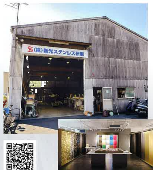
台湾ショールーム

ステンレス研磨の代表的な鏡面・ヘアライン・パイブレーション研磨をはじめ、アルミニウム研磨も手がけ、それぞれの素材の個性を活かして新しい表情を引き出すべくオリジナル研磨を確立。このオリジナル研磨とは新光ステンレス研磨ならではの特徴的な製品であり、主に手作業で製作する意匠研磨である。有名アパレル店舗、商業施設や個人住宅等幅広く使用されている。職人の確かな腕で生み出される研磨加工は、海外からも注目を集め始めている。