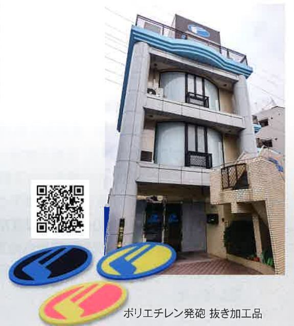
ポリエチレン発砲 抜き加工品

スポンジ・ゴム・プラスチックの製造・加工・販売を行っている。建設機械、旋回部の樹脂成形品及びゴムシール製品やケースに製品を納める為のケース内装品、マラソンの吸水用スポンジ等が主要生産品である。小ロットから対応し、お客様の要望によっては専用の機械を作成する等、柔軟な対応力に長けている。その一例として、スポンジの専用カット機械を作成して難しい斜めカットの量産品を実現した実績がある。また、工夫をして、顧客満足だけでなく従業員満足の向上にも努めている企業である。